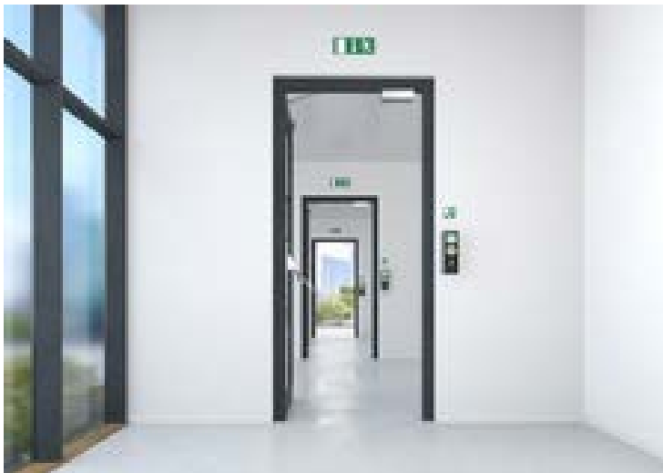
Fluchtwegsicherungssystem SafeRoute

Auch in der Art der Kundenansprache geht dormakaba innovative, digitale Wege. Mit dem Virtual Design Center Interactive erleben die Besucher ein besonderes Highlight. Mit dieser neuen Dimension eines einzigartigen Erlebnisses haben die Fachbesucher die Möglichkeit, in virtuelle Kundensegmente, wie z.B. Flughafen, Industrie oder Hotel, einzutauchen und sich dort in einem virtuellen Showroom als Avatar virtuell mit anderen zu treffen, miteinander zu sprechen und Produkte und Lösungen von allen Seiten anzuschauen.